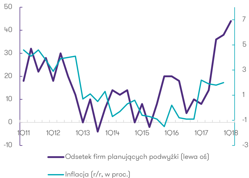
Wykres 1: Odsetek średnich i dużych firm w Polsce, które planują podwyżki cen w 12 miesiącach pomniejszony o odsetek tych, które planują obniżki (fioletowa linia, lewa oś, w pkt proc.) oraz kwartalny wskaźnik inflacji (niebieska linia, prawa oś, r/r, w proc.)

Dotąd nasz wskaźnik skłonności firm do podnoszenia cen był dość dobrze skorelowany z późniejszymi faktycznymi odczytami inflacji (patrzy wykres obok). Gdyby ta korelacja miała się utrzymać, oznaczałoby to dość silny wzrost inflacji w trakcie 2018 r.