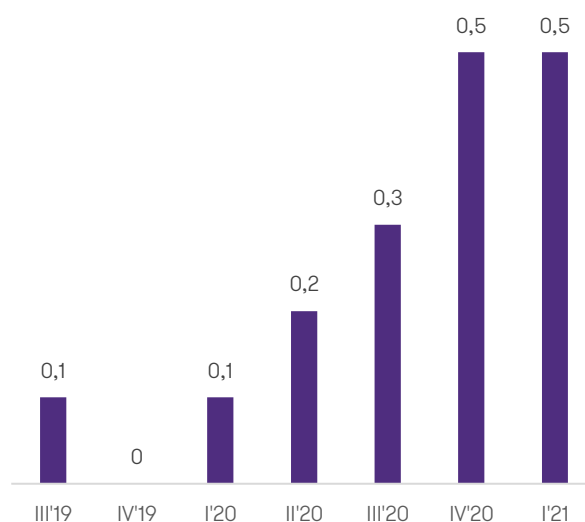
Wykres 2. Wynik EBITDA spółek z branży biotechnologia notowanych na GPW (w mld)

Wydawać by się mogło, że los uśmiechnął się w podobny sposób również do branży producentów sprzętu medycznego . Jeśli spojrzeć na branżę jako całość, rzeczywiście tak jest. Przez rok spółki te niemal potroiły przychody (z 1 mld zł do 2,7 mld zł) i zwiększyły wynik EBITDA o 1457% (z 0,1 do 1,4 mld zł). Należy jednak zwrócić uwagę, że pandemia podzieliła branżę na dwie grupy – na spółki, które silnie skorzystały na pandemii oraz te, które na niej straciły, ponieważ walka z koronawirusem spowodowała spadek zainteresowania pacjentów i placówek medycznych innymi usługami medycznymi.