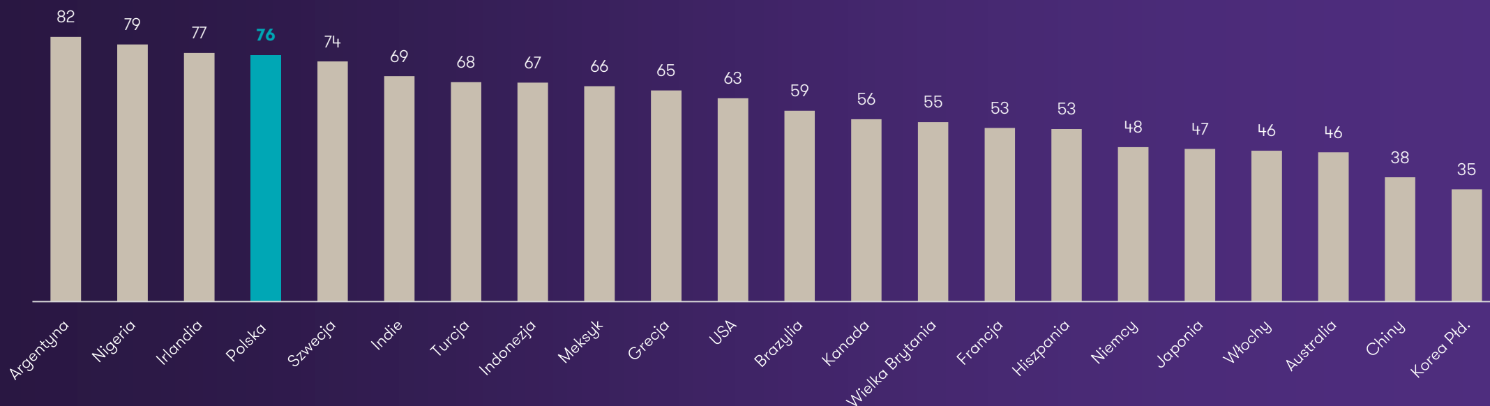
Wykres 2. Odsetek średnich i dużych firm, które w najbliższych 12 miesiącach planują podwyżki cen (w %)