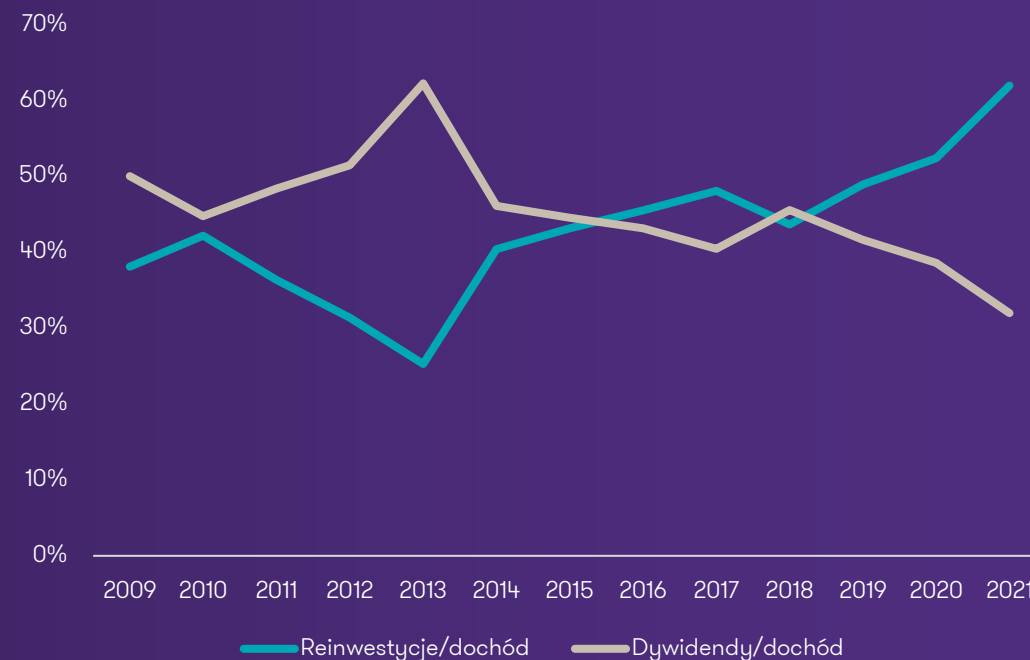
Wykres 3. Reinwestycje i dywidenda w relacji do całości dochodu zagranicznych inwestorów (w %)